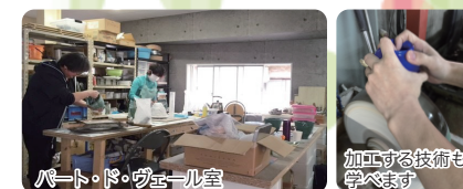
パート・ド・ヴェール室

型の中にガラスを充填して熔融、成形する技法です。原型制作、型取り、ガラス粉の作り方、充填、焼成、型はずし及び、研磨をご指導します。