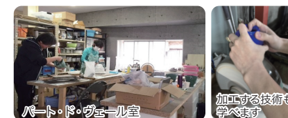
パート・ド・ヴェール室

型の中にガラスを充填して熔融、成形する技法です。原型制作、型取り、ガラス粉の作り方、充填、焼成、型はずし及び、研磨をご指導します。