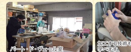
パート・ド・ヴェール室

型の中にガラスを充填して熔融、成形する技法です。原型制作、型取り、ガラス粉の作り方、充填、焼成、型はずし及び、研磨をご指導します。